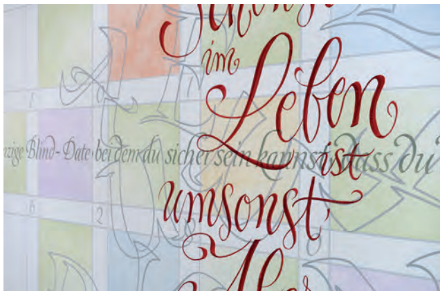
Wandkalligrafie (Ausschnitt) von Joachim Propfe.

»Faszinierend an Schriftgestaltung und Kalligrafie ist für mich, vor allem in meinen freien künstlerischen Werken, stets der inhaltliche Aspekt. Ihm versuche ich jenseits des schönen Schreibens durch Form und Farbe Ausdruck