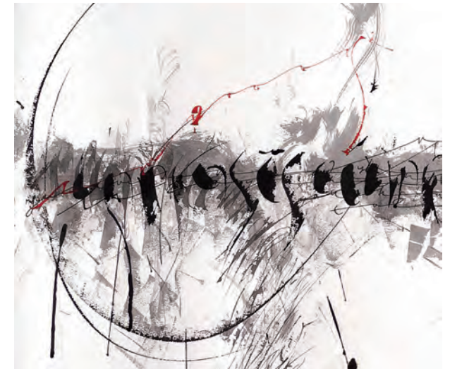
Kalligrafie (Ausschnitt) von Claudia Dzengel.

In ihren Workshops für Kinder und Erwachsene ist es ihr ein Anliegen die »Kunst des schönen Schreibens« von einer neuen Seite kennenzulernen. Ihr Buch »Kalligrafie und kreatives Schreiben für Kinder« (G & G Verlag) wurde mehrfach ausgezeichnet. Parallel zur Ausstellung findet im Rahmen der Kunstwoche Steyr (09. – 13. 07. 2016) ein Kalligrafie-Workshop statt, der sowohl für EinsteigerInnen als auch für Schreiberfahrene geeignet ist. Weitere Infos unter www.claudia-dzengel.com