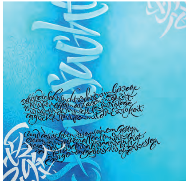
»Sucht«; Kalligrafie von Joachim Propfe.

zu geben, das abstrakte Wort verwandelt sich wieder in ein Bild«, so der Künstler. Durch diese malerische Sicht kann auch die Farbe als emotionales, interpretatorisches Element ihre Wirkung entfalten. Sie ist nicht nachträgliches Kolorit, sondern selbstverständlicher Bestandteil des Bildes von Anfang an. Die Ausstellung zeigt Arbeiten seines freien sowie angewandten Schaffens.